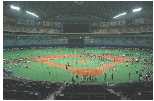
(第1回全国大会の写真)