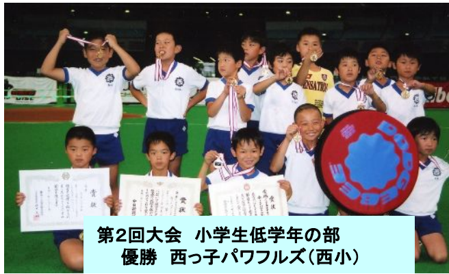
第2回大会 小学生低学年の部 優勝 西っ子パワフルズ(西小)

第1回大会 2005年7月31日 in ナゴヤドーム 東海地区を中心に148チーム・2208人の参加 (新城市より11チーム参加) 小学生低学年の部 3位 サスケキッズ(東小) 一般の部 準優勝 ネバズ(東中) 低学年の部 燃えろファイターズ( ) 西っ子パワフルズ(西小) 西小キッズ3 (西小) 高学年の部 東郷東小A (東小) 東郷東小B (東小) 6年ファイターズ ( ) 毒キノファイター ( ) ショーヤーズ ( ) 1般の部 大谷大学レク講座