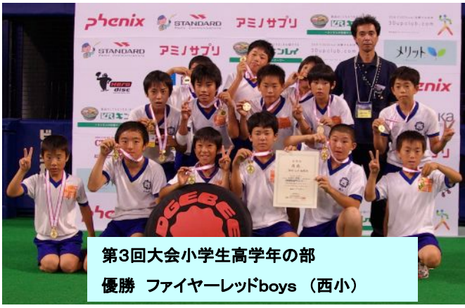
第3回大会小学生高学年の部 優勝 ファイヤーレッドboys (西小)

第3回大会 2007年7月29日(日) in ナゴヤドーム 全国9府県から102チーム・1503人参加 (新城市より6チーム参加) 小学生高学年の部 優勝ファイヤーレッドboys (西小) 小学生低学年の部 準優勝西小ボンバーズ (西小) 高学年の部 東郷東小 (東小) 西っ子パワフルズ(西小) サスケキッズ(東小)