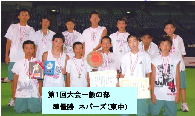
第1回大会一般の部 準優勝 ネバズ(東中)

第1回大会 2005年7月31日 in ナゴヤドーム 東海地区を中心に148チーム・2208人の参加 (新城市より11チーム参加) 小学生低学年の部 3位 サスケキッズ(東小) 一般の部 準優勝 ネバズ(東中) 低学年の部 燃えろファイターズ( ) 西っ子パワフルズ(西小) 西小キッズ3 (西小) 高学年の部 東郷東小A (東小) 東郷東小B (東小) 6年ファイターズ ( ) 毒キノファイター ( ) ショーヤーズ ( ) 1般の部 大谷大学レク講座