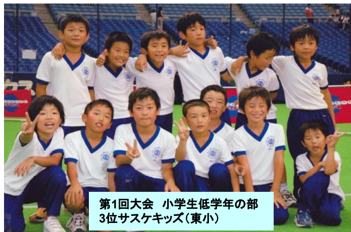
第1回大会 小学生低学年の部 3位サスケキッズ(東小)

第2回大会 2006年7月16日(日) in ナゴヤドーム 2000人を超えるエントリーと3000人を超える観客数 (新城市より10チーム参加) 小学生低学年の部 優勝 西っ子パワフルズ(西小) 低学年の部 新城ファイターズ( ) 高学年の部 東郷東小A (東小) 東郷東小B (東小) サスケキッズ (東小) 西小キッズ4(西小) ゴールデンジャイアンツ( ) たこやき ( ) ぐるぐるまわるーズ( ) 1般の部 新城大谷大学