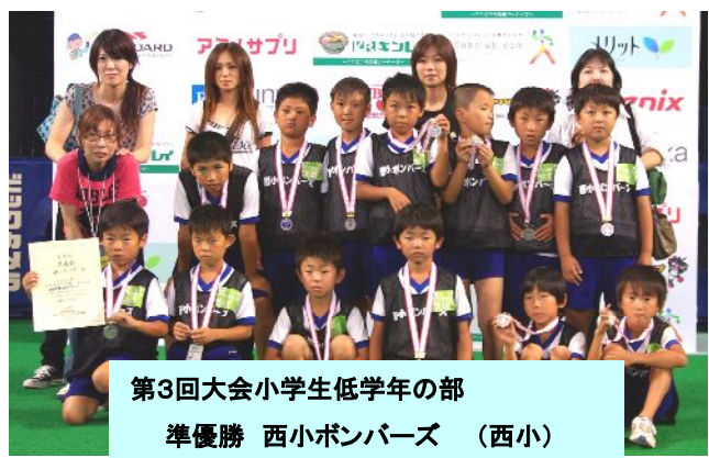
第3回大会小学生低学年の部 準優勝 西小ボンバーズ (西小)

第3回大会 2007年7月29日(日) in ナゴヤドーム 全国9府県から102チーム・1503人参加 (新城市より6チーム参加) 小学生高学年の部 優勝ファイヤーレッドboys (西小) 小学生低学年の部 準優勝西小ボンバーズ (西小) 高学年の部 東郷東小 (東小) 西っ子パワフルズ(西小) サスケキッズ(東小)